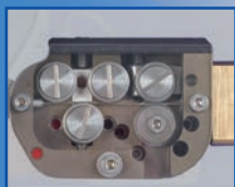
Привод Polyfil Compact с механизмом правки проволоки